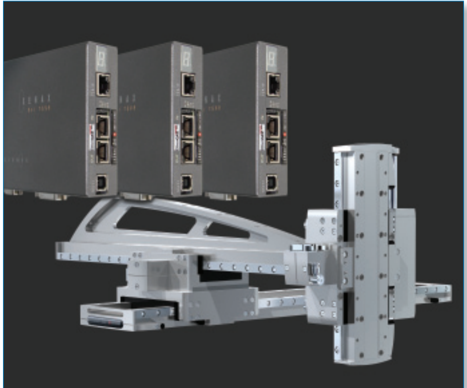
3-Achsen-Flächenausleger: Dank Master-/Slave-Funktion ist kein übergeordneter Positionscontroller notwendig.

D4, Platz 4, 6039 Root D4 Tel. 041 455 44 55, Fax 041 455 44 50 www.jennyscience.ch alois.jenny@jennyscience.ch