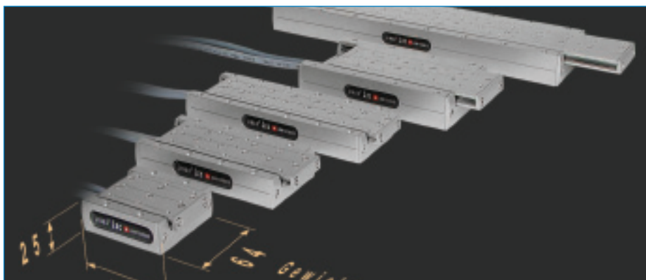
Baureihe Linax Lxc, auch beim Gewicht eine Klasse für sich. Die kleinste Linearmotorachse wiegt nur 350 g inkl. Führung und Messsystem.

Alle reden vom Energiesparen, das Thema hat zwar höchste Brisanz in Politik und Wirtschaft, aber Effizienz geht weiter. Man betrachtet nicht nur den Verbraucher, sondern auch den Erzeuger, Aufbereiter und Verteiler. Effizienz bedeutet den gewünschten Nutzen mit geringstem Aufwand zu erreichen. Am Anfang steht der Nutzen. Wenn Sie z.B. 100 g leichte Teile bewegen wollen und dazu grosse, schwere Antriebssysteme einsetzen, so ist das ineffizient, auch wenn diese Antriebssysteme 98% Wirkungsgrad haben. Das unnötige Beschleunigen und Verzögern von «Leermasse» verbraucht den grössten Teil der Energie.