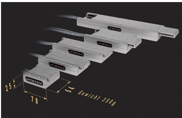
Baureihe Linax Lxc: Die kleinste Linearmotorachse wiegt nur 350 g inklusive Führung und Messsystem.

Folge sind dafür große Räumlichkeiten gefragt, die wiederum beheizt und klimatisiert werden müssen. So werden unnötige Ressourcen verbraucht, was sich direkt auf die Produktions- und Investitionskosten niederschlägt. Es spricht daher alles dafür, Maschinen und Apparate leichter und mit kleineren Abmessungen zu bauen. Mit