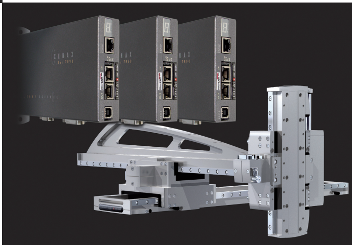
3-Achsen-Flächenausleger: Dank Master-/Slave Funktion ist kein übergeordneter Positionskontroller notwendig.

anderer zu positionieren ist ein übergeordneter Positionskontroller notwendig. Nicht so bei den neuen XENAX Xvi 75V8 Servocontrollern. Der Servocontroller mit der Nummer 1 ist der Master. Nur auf diesem erfolgt die Ablaufprogrammierung. Der Master erkennt über den schnellen, effizienten I2C-Bus seine Slaves automatisch. Bis zu