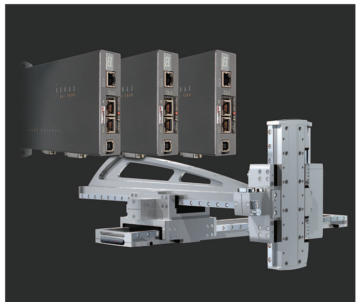
3 Achsen Flächenausleger: Dank Master-/Slave Funktion kein übergeordneter Positioncontroller notwendig.